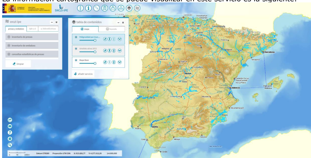
Imagen general del servicio

La información cartográfica que se puede visualizar en este servicio es la siguiente: